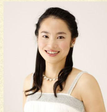
谷口美也 ソプラノ