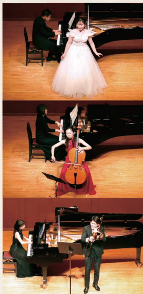
第9回奨学生披露演奏会より

出演校:東京藝術大学、桐朋学園大学、東京音楽大学、 武蔵野音楽大学、国立音楽大学、愛知県立芸術大学、 京都市立芸術大学、同志社女子大学、大阪音楽大学、 相愛大学、沖縄県立芸術大学より