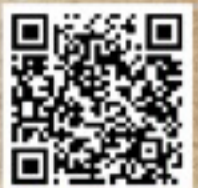
絵本仕立ての演奏会 クラファンサイト