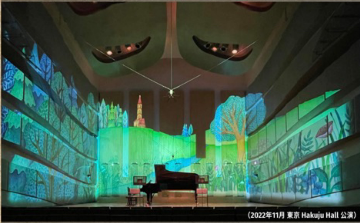
(2022年11月 東京 Hakuju Hall 公演)