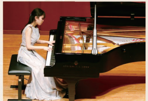
第10回 奨学生成果披露演奏会より